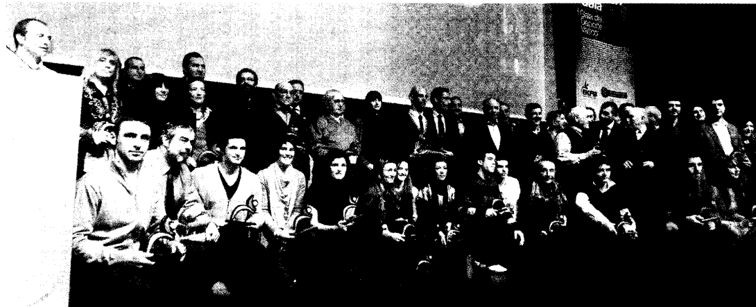
Todos los galardonados posan con sus trofeos en el estrado principal del Kursaal.